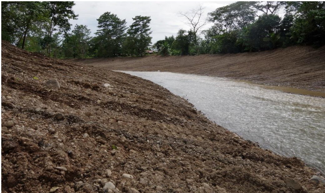
Río Balsar, parte del límite del Sitio Arqueológico Grijalba 2

En esa segunda etapa es donde se procede a evaluar y dar valor a los riesgos según su probabilidad de que ocurran y el nivel de impacto que tendría si se llegara a materializar.