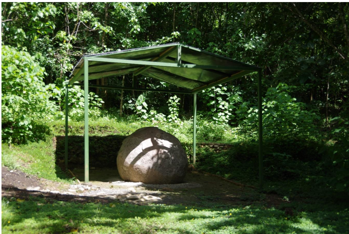
Esfera de piedra precolombina de mayor magnitud encontrada

Se sitúa en las coordenadas geográficas: 8°57'04" N, -83°26'28" W