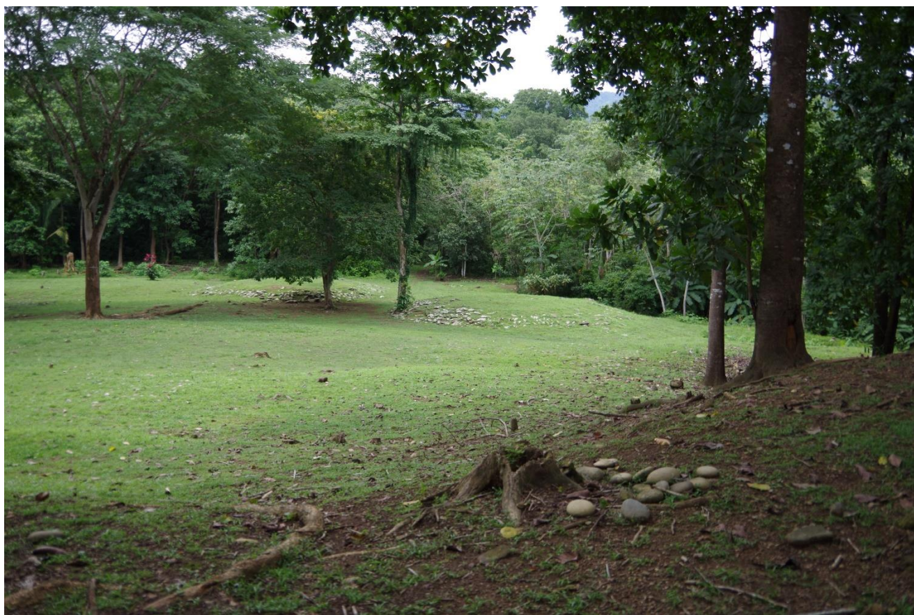
Vista de los montículos del monumento Arqueológico Grijalba Dos

El complejo arqueológico denominado Grijalba 2, se encuentra ubicado en Puerto Cortés (Conocido como Ciudad Cortés), en las coordenadas geográficas: 8°58'55" N, -83°31'22" W.