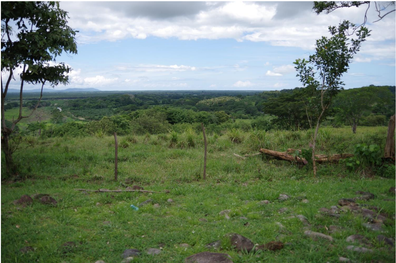
Vista total del Delta del Diquís desde el Monumento Arqueológico Batambal

Este Monumento Arqueológico tiene la particularidad de que la propiedad es un cien por ciento un asentamiento precolombino, lo que limita por completo la construcción de infraestructura para albergar a los visitantes.