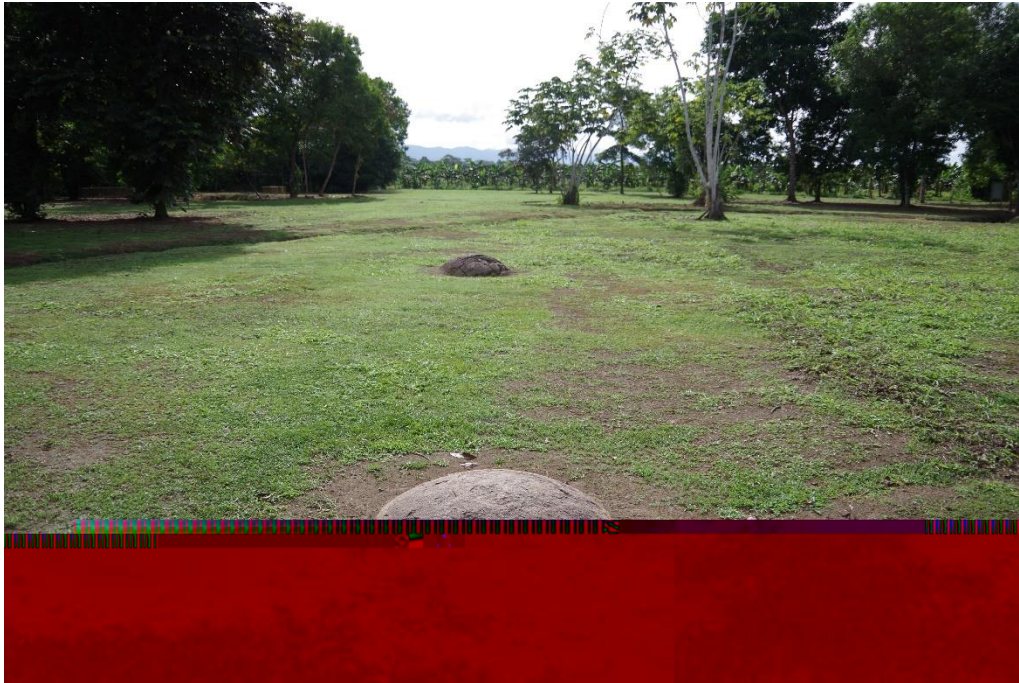
Alineamiento de esferas – Sitio Finca Seis

Para este Sitio, el cual es quizá, al que más estricto se calificó por ser al que más recursos se le han invertido y por ser el más visitado, se tienen los siguientes resultados: