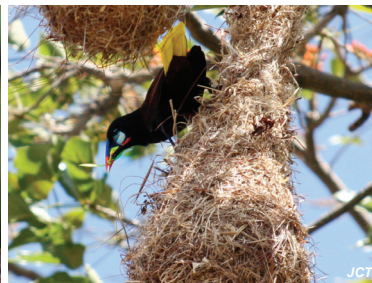
Psarocolius montezuma Oropéndola de Montezuma Montezuma Oropendola