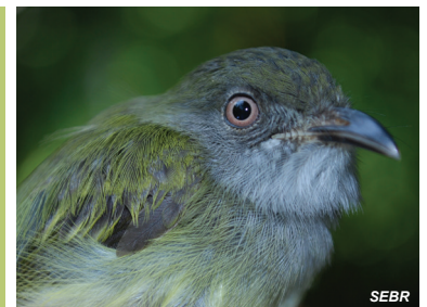
Oncostoma cinereigulare Piquitorcido norteño Northern Bill