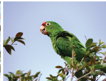
Psittacara finschi Perico frentirrojo Crimson-fronted Parakeet