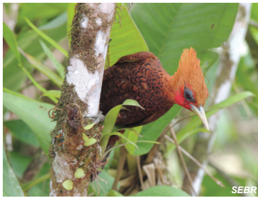
Celeus castaneus Carpintero castaño Chestnut-colored Woodpecker