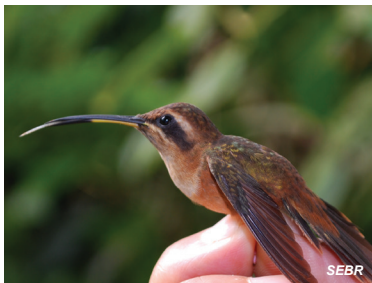
Phaethornis striigularis Ermitaño enano Stripe-throated Hermit