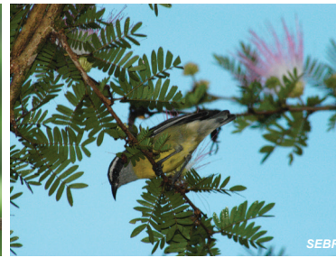
Coereba flaveola Reinita mielera Bananaquit