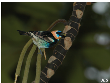
Tangara larvata Tangara capuchidora Golden-hooded Tanager