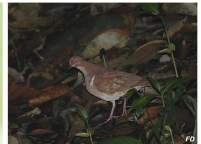
Geotrygon montana Paloma perdiz rojiza Ruddy Quail-Dove