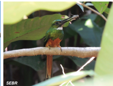
Galbula ruficauda Jacamar rabirrufo Rufous-tailed Jacamar