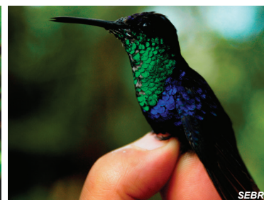
Thalurania colombica Ninfa coronioleto Crowned Woodnymph