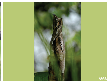
Nyctibius griseus Pájaro estaca, Nictibio común Common Potoo