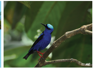
Cyanerpes cyaneus Mielero patirrojo Red-legged Honeycreeper