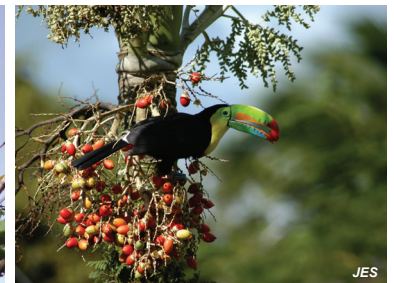
Ramphastos sulfuratus Tucán pico iris Keel-billed Toucan