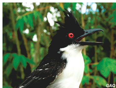
Taraba major Batará grande Great Antshrike