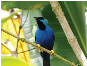
Cyanerpes lucidus Mielero luciente Shining Honeycreeper