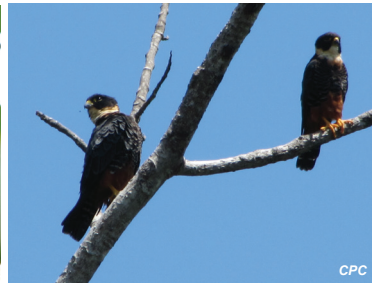
Falco rufigularis Halcón cuelliblanco Bat falcon