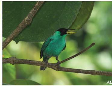
Chlorophanes spiza Mielero verde Green Honeycreeper