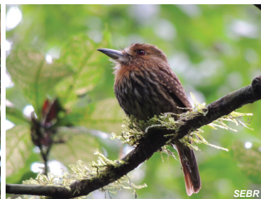
Malacoptila panamensis Bucu barbón White-whiskered Puffbird