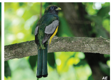
Trogon rufus Trogon cabeciverde Black-throated Trogon